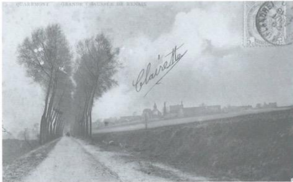
Deze kaart toont hoe de weg van Ronse naar Kwaremont erbij lag in de periode van de Eerste Wereldoorlog. Wat een schril contrast met de brede, drukke weg die de Ronsebaan geworden is!

Hier zie je de weg naar Kwaremont 100 jaar geleden en nu.