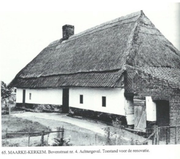
65. MAARKE-KERKEM. Bovenstraat nr. 4. Achtergevel. Toestand voor de renovatie.

Weetje C. Het genot op den berg ( Bovenstraat 4 ). Dit voormalig boerenhuis werd vanaf 1977 gerenoveerd en sedert 1995 wordt er een restaurant uitgebaat. Voordien hout- en leembouw met strodak (zie foto). Bij de renovatie werd de originele vakwerkbouw en de dakspanten behouden. Het strodak werd vervangen door een rieten bedekking. Op de deurlatei boven de vroegere voordeur en